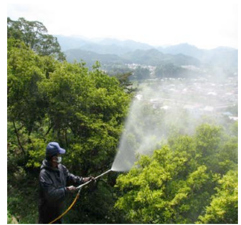
年に3回、観光協会作業員による山つつじの消毒を行っています。