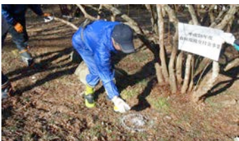
昨年度のボランティア作業の様子

◆毎年4月下旬から5月上旬にかけて約4,000本の風呂山公園の山つつじが真っ赤に色づき、町の方々や観光に訪れる人を楽しませてくれます。